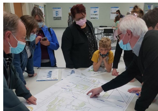
Section « participer », thématique 1