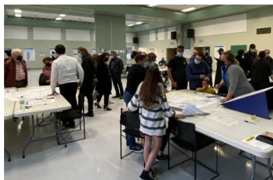
Vue d'ensemble de la section « participer »