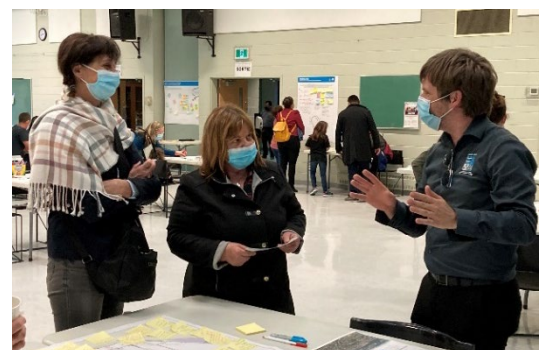
Section « participer », thématique 2