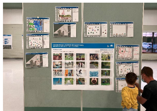
Atelier de vote et dessins de parcs