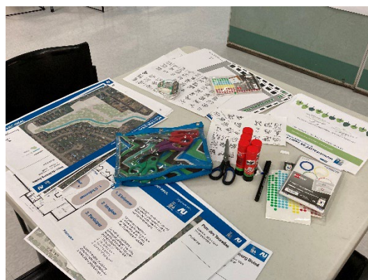
Atelier de dessin et bricolage