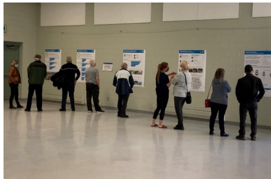
Section « s'informer »