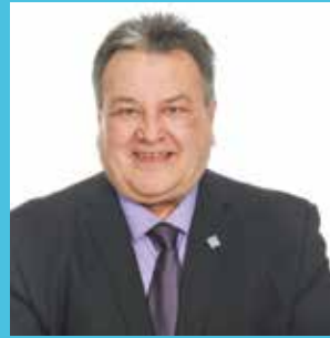
ALAIN BELLEMARE maire